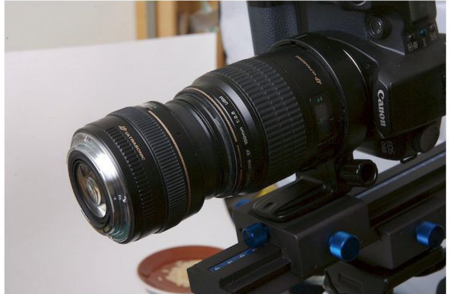
Les deux objectifs assemblés